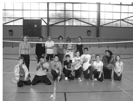
L'équipe de badminton