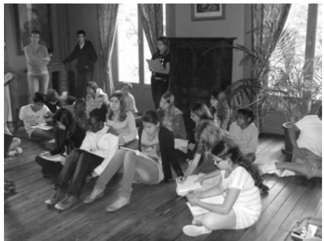
Un groupe dans la chambre de Zola en train d'écouter la guide.