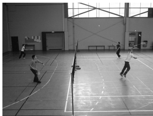
Elèves jouant au badminton