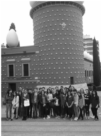
Devant le musée Dali

Un car nous attend à la gare, et encore 3 heures de voyage jusqu'à Figueras , la ville natale de Salvador Dali , où nous