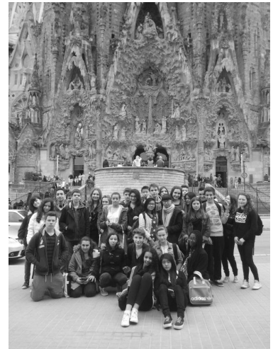
Devant la Sagrada Família

Nous reprenons ensuite le car pour nous rendre à l'entraînement des castellers (tours humaines typiques de Catalogne).